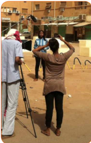
Shooting in central Khartoum