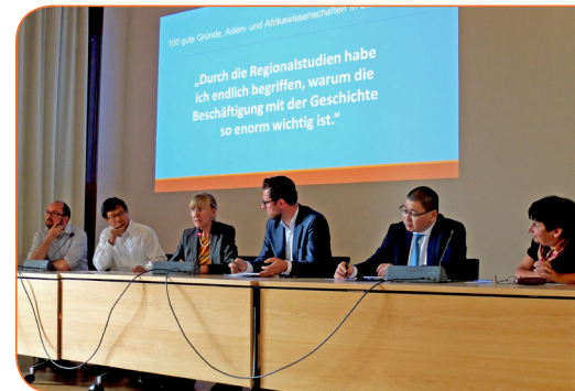
IAAW-Symposium Juni 2017