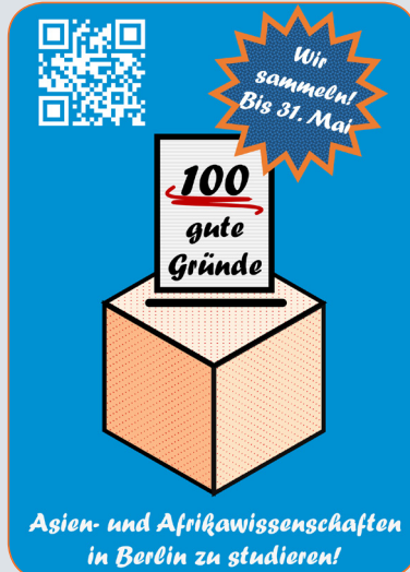
Aktionsposter © Joshua Woller/Nadja-Christina Schneider