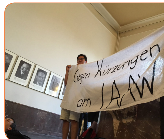
Studentische Protestaktion Juni 2017