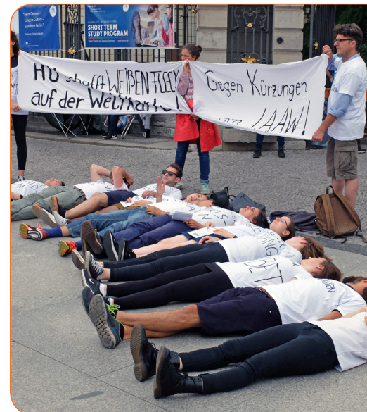
Studentische Protestaktion Juni 2017