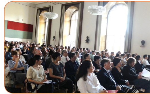
IAAW-Symposium Juni 2017