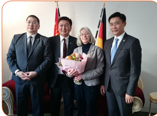
Tsolmon Bolor, Sodbaatar Yangug, Uta Schöne, Yondonperenlei Baatarbileg