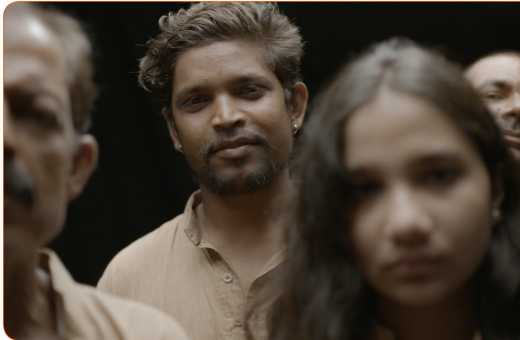
Begegnung im „Black Room“

Dennoch offenbarten sich mir zahlreiche Möglichkeiten des Mediums Film, die mir in einer Forschungsarbeit verwehrt bleiben: Ein Film darf oder vielmehr sollte provozieren, verwirren, Emotionen auslösen, er muss keine Fragen beantworten und kann solche stellen, die z.B. die Feldforschung nicht beantworten kann. Ich habe mir die Frage gestellt, was passiert, wenn wir so viele Zeichen sozialer Zugehörigkeit wie nur möglich von unseren Protagonist*innen abstreifen und sie dann in einem neutralen Raum miteinander konfrontieren.