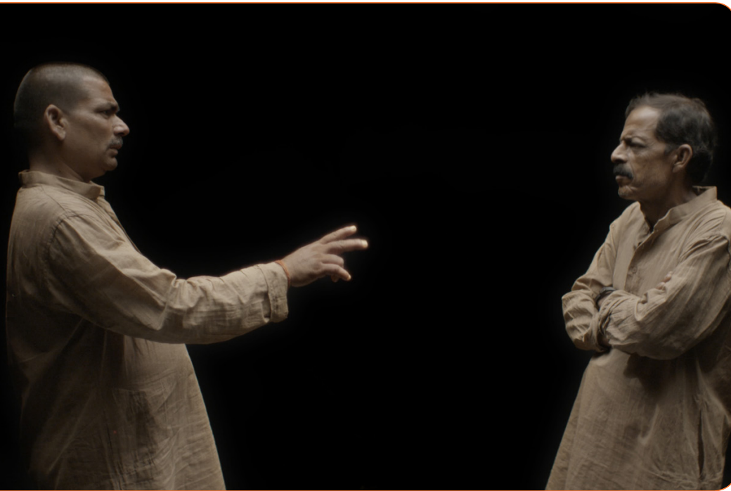
Begegnung im „Black Room“

In einem im Filmstudio aufgebauten, schwarz abgehängten Raum begegneten sich die Protagonist*innen von ihrem sozialen Kontext gelöst in neutrale Gewänder gekleidet zum ersten Mal in ihrem Leben: Ein muslimischer Kleinbauer, ein Sharbat-Verkäufer und Anhänger der Hindutva-Bewegung, eine junge Literaturstudentin aus der Oberschicht und ein obdachloser Drogendealer. Sie in diesen artifiziellen filmischen Raum zu bringen, hat mir Dinge über sie und die Hierarchien der Gesellschaft, in der sie leben, verraten, die eine Feldforschung nicht zu Tage hätte bringen können. Gegen Ende des Jahres wird die Postproduktion des Films abgeschlossen sein.