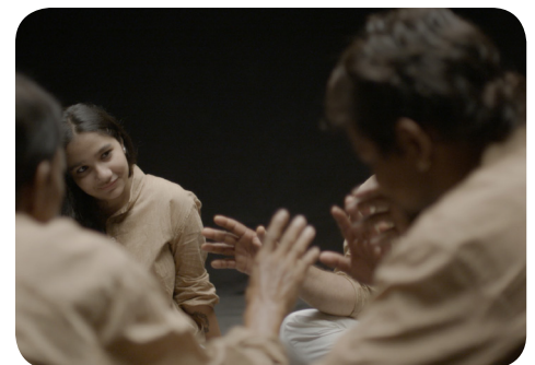
Begegnung im „Black Room“