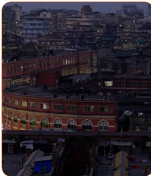
Kalkutta, New Market in der Dämmerung

In einem im Filmstudio aufgebauten, schwarz abgehängten Raum begegneten sich die Protagonist*innen von ihrem sozialen Kontext gelöst in neutrale Gewänder gekleidet zum ersten Mal in ihrem Leben: Ein muslimischer Kleinbauer, ein Sharbat-Verkäufer und Anhänger der Hindutva-Bewegung, eine junge Literaturstudentin aus der Oberschicht und ein obdachloser Drogendealer. Sie in diesen artifiziellen filmischen Raum zu bringen, hat mir Dinge über sie und die Hierarchien der Gesellschaft, in der sie leben, verraten, die eine Feldforschung nicht zu Tage hätte bringen können. Gegen Ende des Jahres wird die Postproduktion des Films abgeschlossen sein.